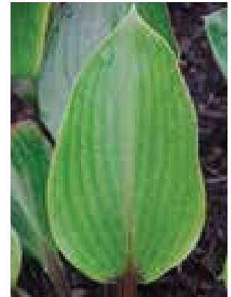
Hosta 'Purple Heart'