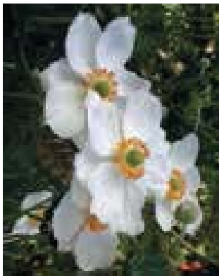
Anemone 'Honorine Jobert'