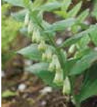
Polygonatum b 'Prince Charming'