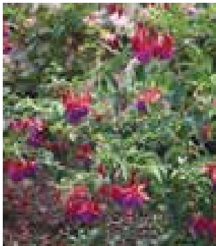
Fuchsia 'Army Nurse'