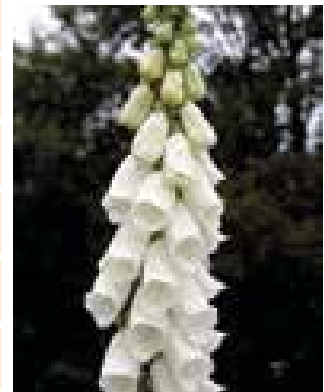
Digitalis pur Alba