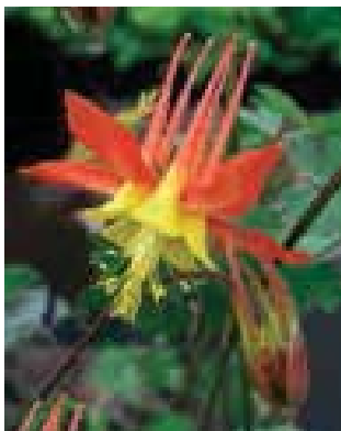
Aquilegia 'Tequila Sunrise'