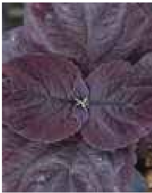
Coleus 'Dk Chocolate'

One man's oasis is another man's problem area in the garden! Some shade is a welcome relief from the mid-day's sun, but full shade can prove to be problematic. Hostas and Ferns are not your only options! Given only a few hours of morning sun or enough indirect light on the north side of a structure or shade tree, the plants below will survive and may help to create the most welcoming and beautiful part of the landscape.